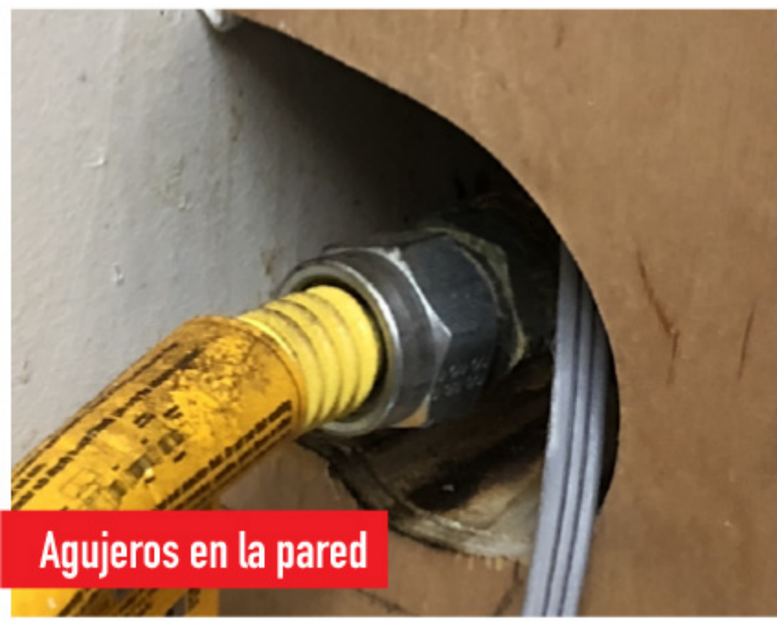
Agujeros en la pared