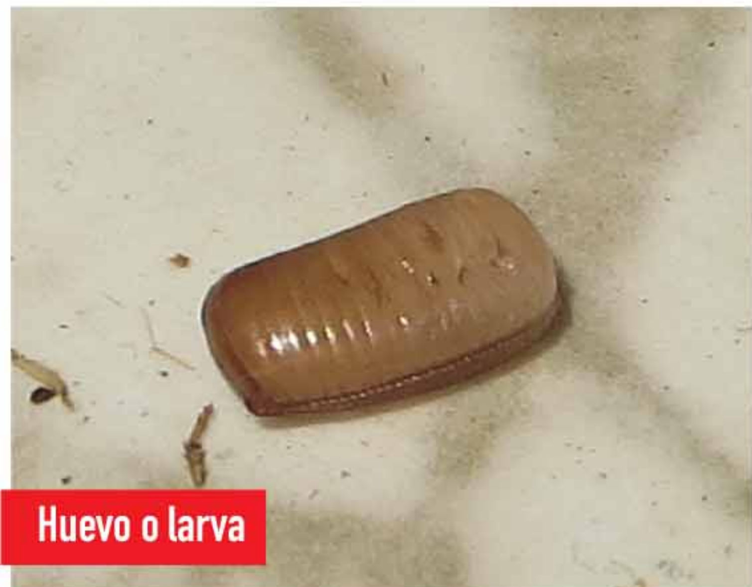
Huevo o larva