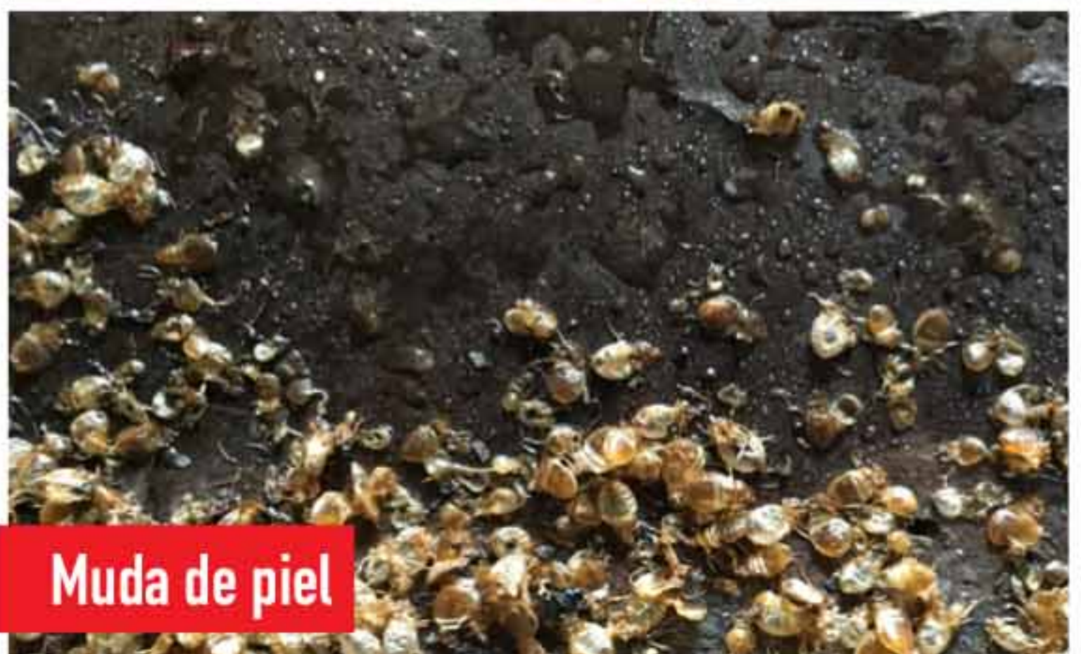
Muda de piel

Llame a la oficina de mantenimiento o a su arrendador si mira estos signos.