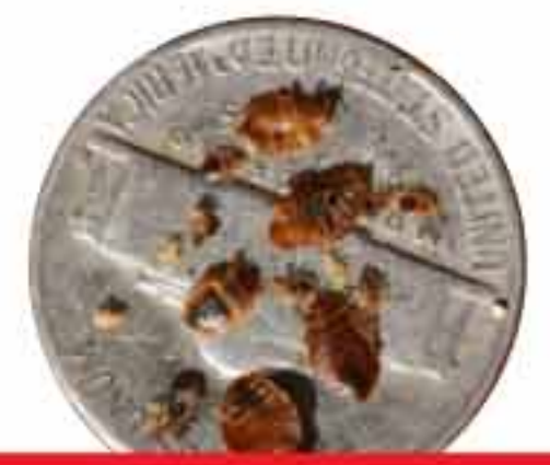
Varias etapas de la vida en un níquel