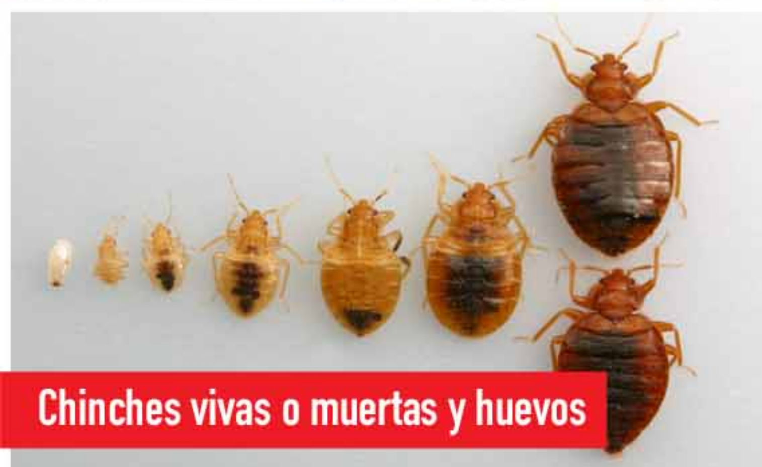
Chinches vivas o muertas y huevos