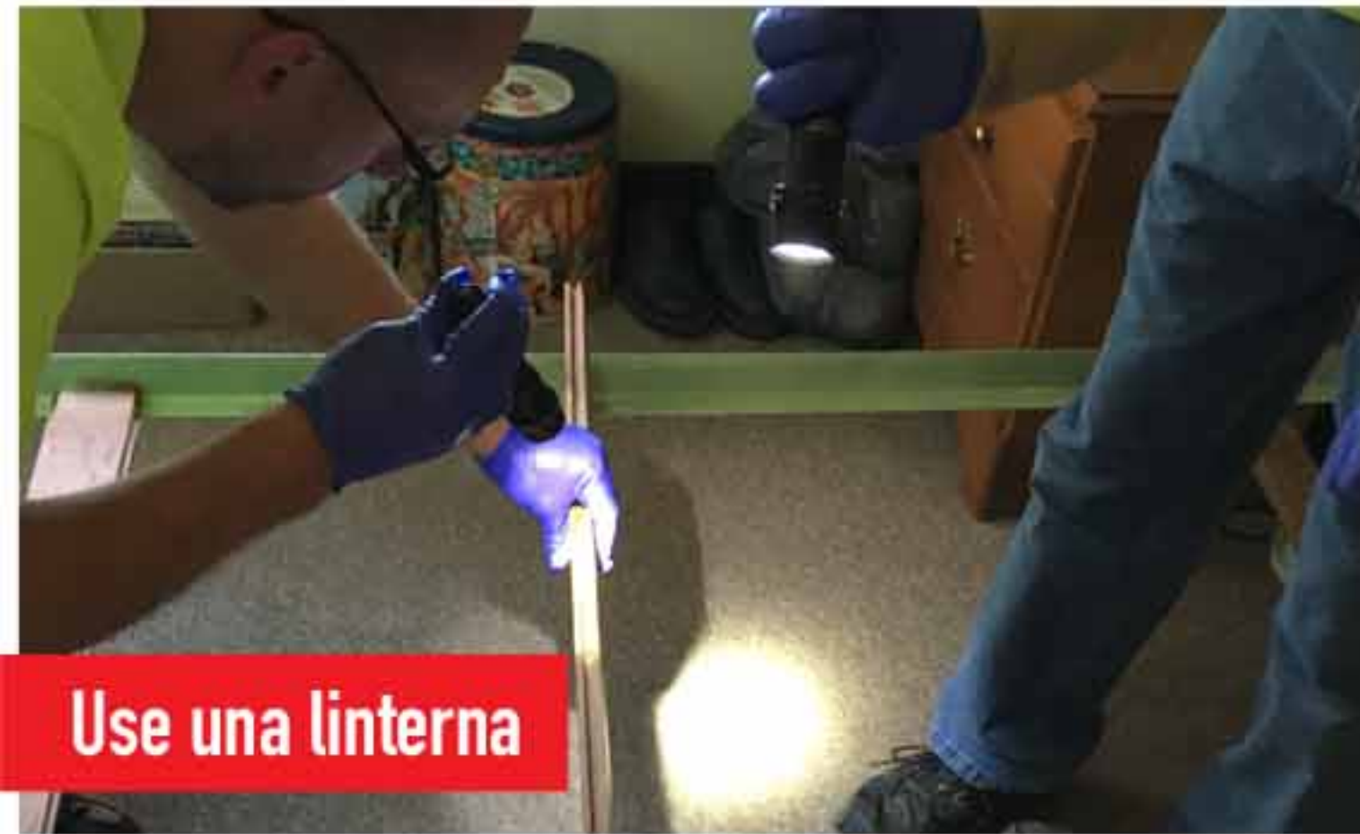
Use una linterna